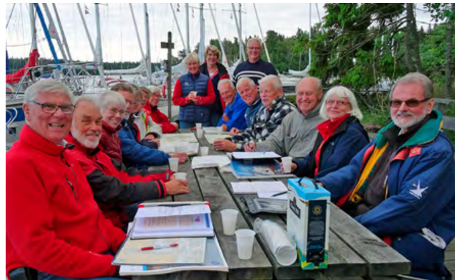
Samtliga fick faktiskt rum kring bordet i gästhamnen i Arholma.