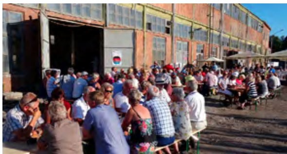
För de totalt 55 båtarna i rikseskaderns arrangerades en gemensam aktivitet i Tallinn – en BBQ på torsdagskvällen.