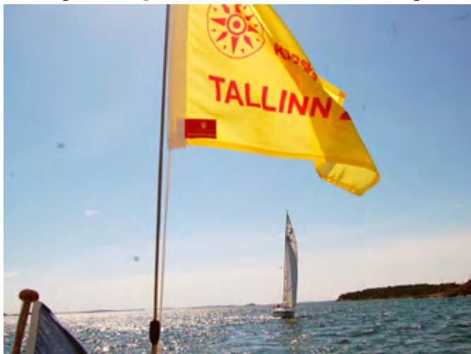
De gula eskadervimplarna utdelades vid skepparmötet på Arholma.