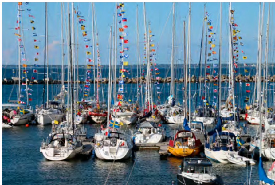
Stor flaggning i Tallinn. 55 båtar från Kryssarklubben.

Sista kvällen i Tallinn samlades hela gänget för BBQ, och olika förtjänst-tecken och attiraljer delades ut och det tackades med stora kramar. Kjell var en baddare på limerickar så varje båt fick sig en. Här är en blek egen av artikelförfattaren: