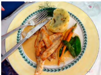
Den gemensamma middagen på restaurang Knipan i Ekenäs hamn satt mycket bra.