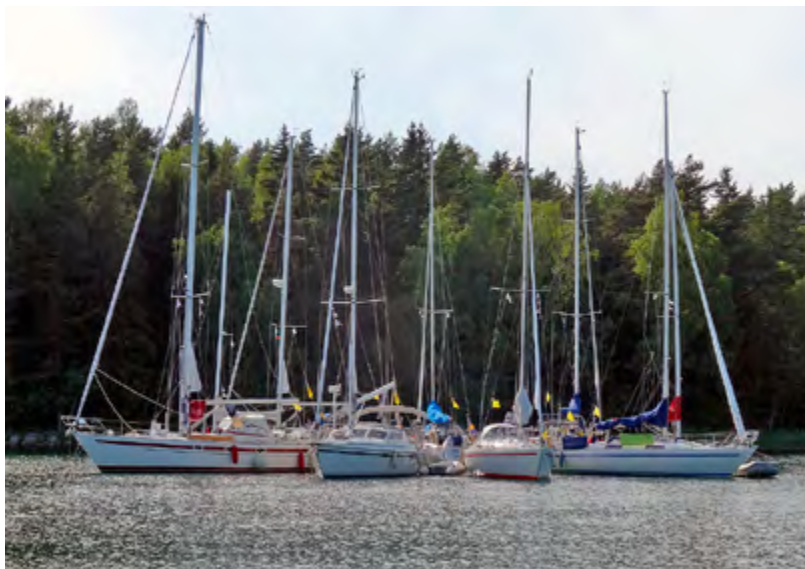
Stjärnankring i Torasviken. (Se även tidningens framsida.)

Nästa dagsetapp innebar fin segling över Skiftet med åskådande sälar till den stora sandön Jurmo, där kapellet och den fascinerande naturen beskådades. Nästa morgon var det tät dimma, något som inträffade även förra gången vi hade en eskader till Jurmo. Det innebar inledningsvis problem, men den kom-