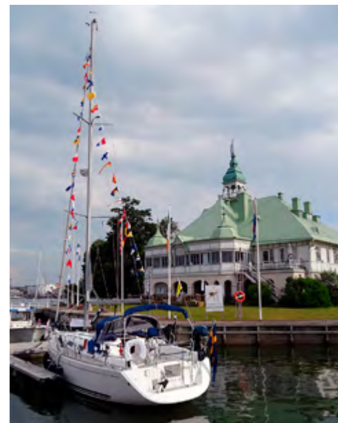
Liisa II framför NJK:s klubbhus i Helsingfors.

Färden till Helsingfors blev jobbig. En liten stund hade vi sikt. Resterande sju timmar blev det motorgång i tjock dimma. Från Caleta , som hade all tänkbar navigationsutrustning, fick vi andra ”optiska navigerare” hjälp att undvika närkontakt med färjor, katamaraner och ryska lastbåtar som korsade vår led. Sveaborg kunde bara siktas från 100 meters håll. Att äntligen kunna lägga till vid Nylands Jaktklubbs gästbrygga vid Blekholmen inne i Helsingfors kändes särdeles skönt, och ändå bättre blev det när Caletas Ulla bjöd på skumpa. Under kvällen blev det middag på jaktklubbens restaurang, där både stämningen och notan blev hög.