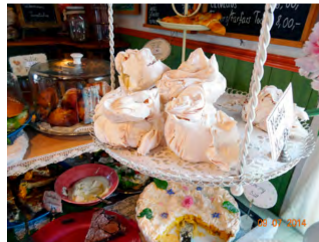
Trots att det var 45 M till Kejsarhamnen i Högsåra hann vi med besök och tårtfrossa på Farmors kaffe och lotsmuseet.